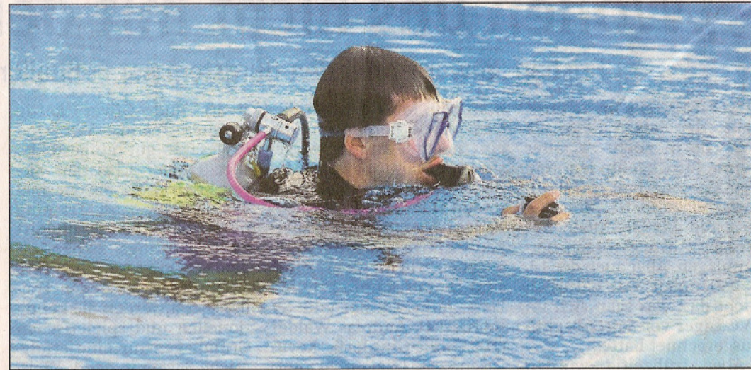
Immer donnerstags treffen sich die Taucher im Sommer zum Training im Gronauer Freibad.